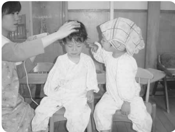
入浴後のひととき

夕食をいっしょに 一年に一度だけやってくる、みんなが楽しみにしている『誕生日』。その誕生日のある月に、お家の人をドリームの夕食に招待し、一緒に夕食を食べるということが、夕食をいっしょにです。その日は朝から「今日、ママご飯を食べながら登園し、「また後で来るからね」と、お母さんも何だかうれしそうに出勤していきます。そして夕方、玄関にお母さんの姿を見つけると、「○○ちゃんママだ」と他の子ども達も嬉しそうに出迎えるのです。お家の人を迎えての夕食は、いつも以上に会話が弾み、「みんな食べるの上手ね」等の声に「ご飯おかわりくださうい」と食欲も増すのです。「家では食べない野菜もみんな一緒だと食べるのですね」「薄味でバランスのとれた食事、家でも心がけたいです」「みんな