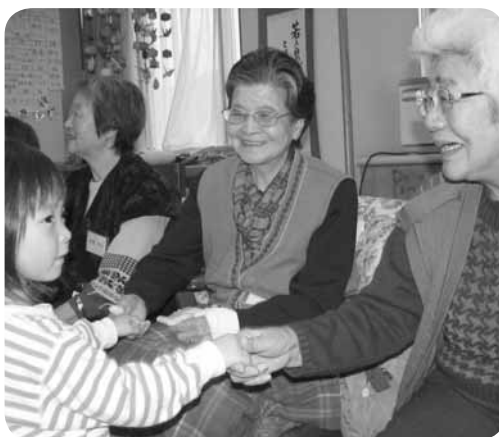
複合施設 悠々デイサービスセンターのおじいさん、おばあさん達との交流